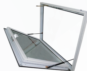
EXUBAIE V2 OS