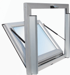
OTF TÔLÉ ISOLÉ