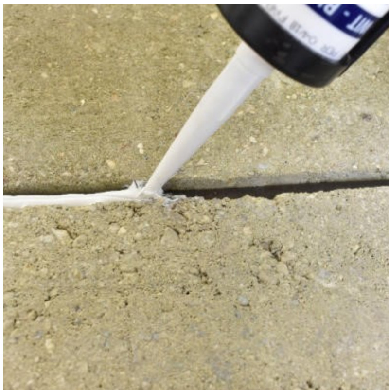
Étanchéité d'un joint de dilatation